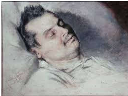
Dernier portrait de Balzac Peint par Eugène Giraud, 18 août 1850, jour de sa mort, Musée de Besançon

« Balzac était presque toujours alité. Un cercle de fer se resserrait, de plus en plus, sur sa poitrine. Il passait ses nuits à suffoquer, cherchant vainement, devant la fenêtre ouverte, à happer un peu de cet air qui ne pouvait plus dilater ses poumons. Ses jambes enflaient, suintaient; 9 l'œdème gagnait le ventre, le thorax. Il ne se plaignait pas, ne désespérait pas. Confiant, comme il avait attendu la fortune, il attendait la guérison, pour se remettre au travail avec une jeunesse, une énergie, un immense besoin de créer, qui le soutinrent jusqu'à l'agonie. 10 »